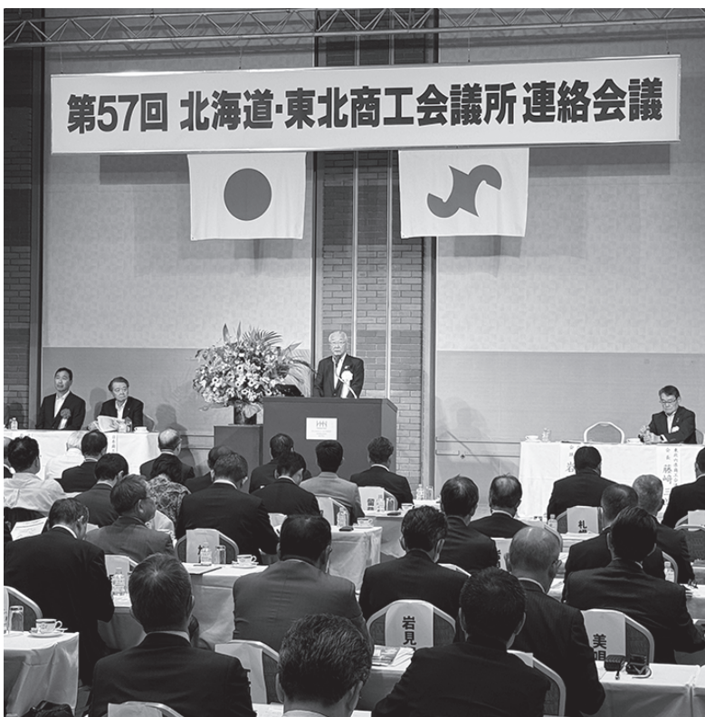
第57回 北海道・東北商工会議所連絡会議

北海道と東北両地域が連携し、相互の交流を深め、両地域の経済発展に寄与することを目的に昭和41年より開催されており、今年度は9月9日、帯広市に於いて北海道・東北商工会議所連絡会議が開催され、北海道・東北87商工会議所から約300名が参加した。