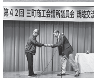
第42回 三町商工会議所議員会 親睦交流